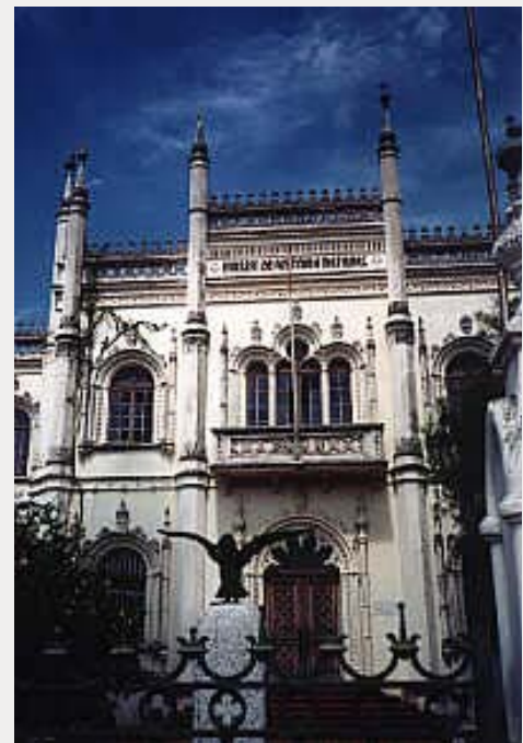
Museum of Natural History